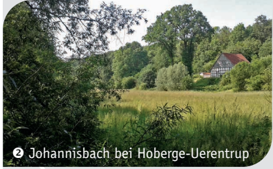
2 Johannisbach bei Hoberge-Uerentrup