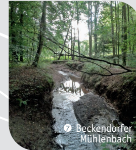
7 Beckendorfer Mühlenbach