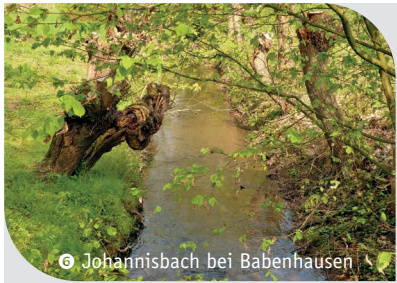
6 Johannisbach bei Babenhausen