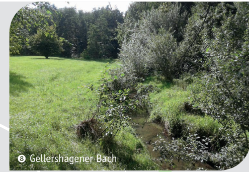
8 Gellershagener Bach