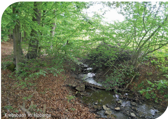
Krebsbach in Hoberge