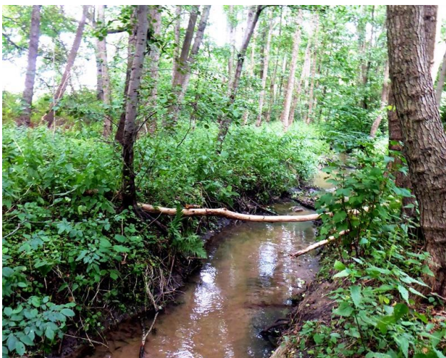
Tüterbach mit Aue