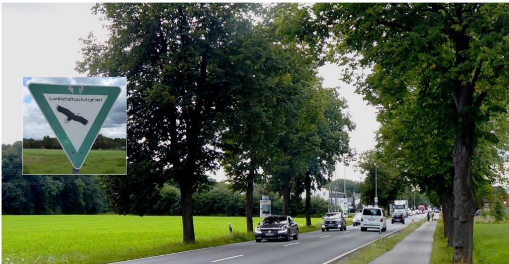
B-Planfläche an der B 61 / Gütersloher Straße mit geschützter Lindenallee