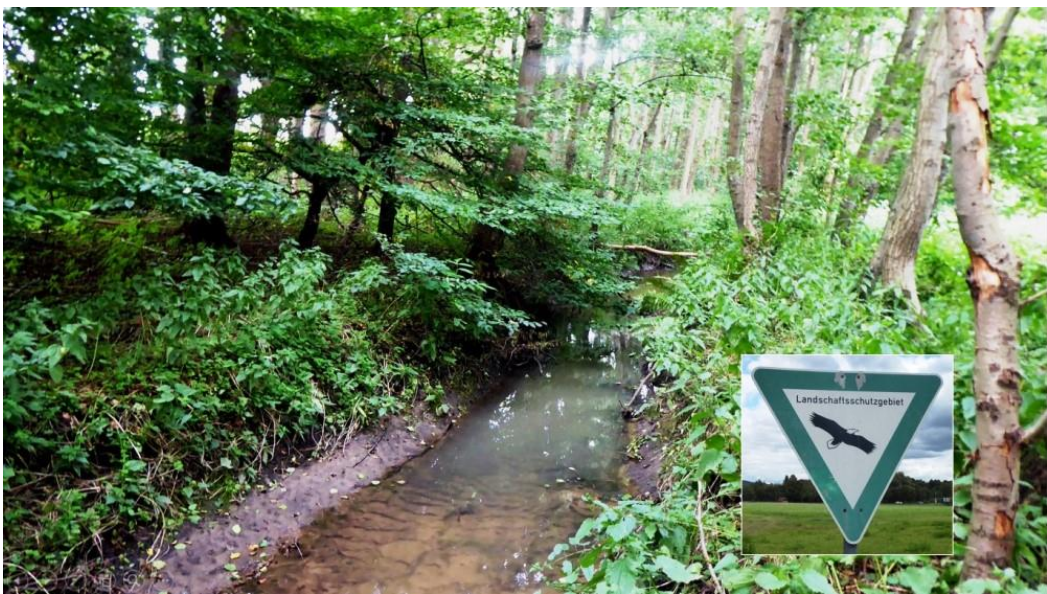
Tüterbach mit Aue