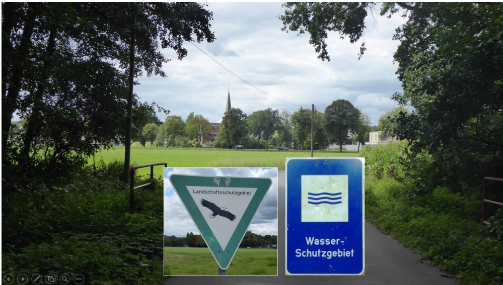
Blick über die B-Planfläche zum Ortszentrum Ummeln