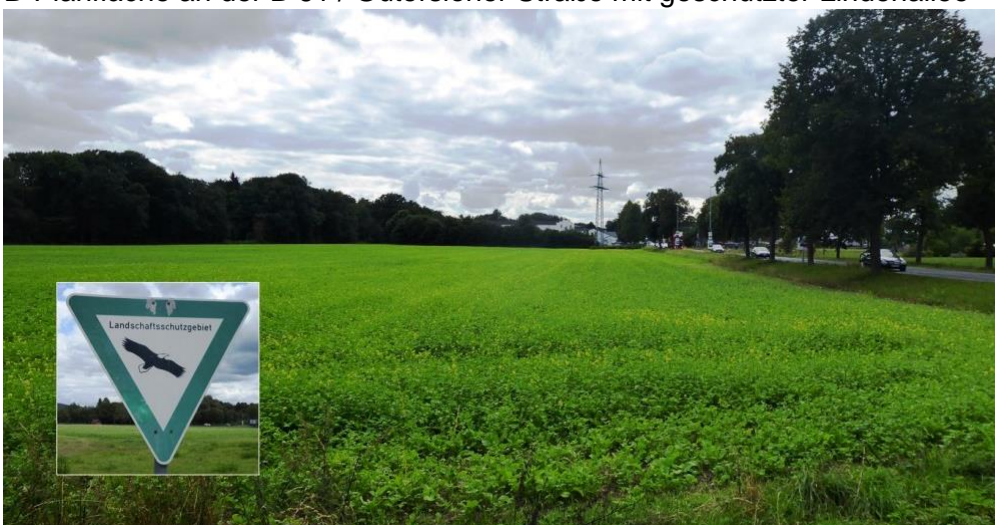
B-Planfläche an der B 61 / Gütersloher Straße