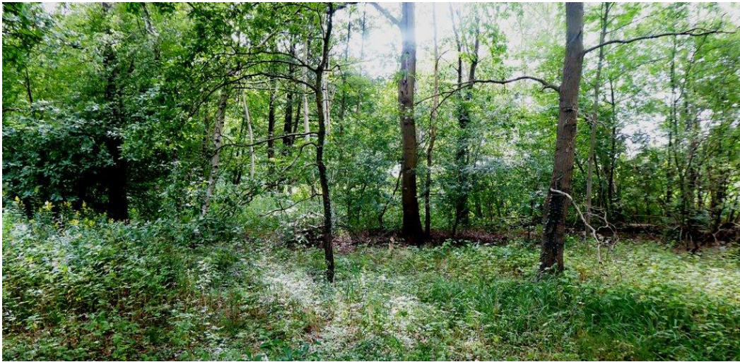
Aue des Tüterbaches